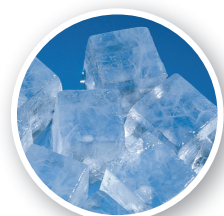
IM-130ANE-HC-23 Eis-Typ: Würfeleis (M) Grösse: 28 x 28 x 23mm