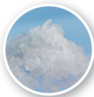
FM-8oKE-HC Eis-Typ: Flockeneis