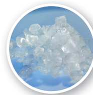
FM-8oKE-HCN Eis-Typ: Nuggeteis