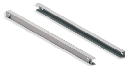
60400066 60400066 Paar Schienen "U"