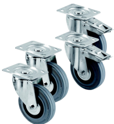
64700553 64700554 Kit Räder