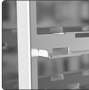
EINHÄNGEGESTELL MIT KIPPSCHUTZ.