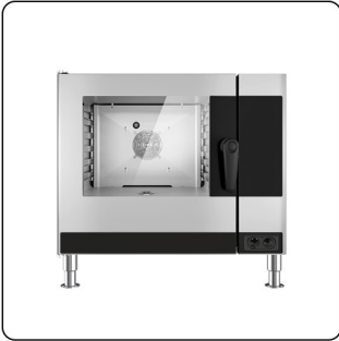
HERGESTELLT KOMPLETT AUS EDELSTAHL AISI 304, MIT GEFLANSCHTE FÜßE ZUR BODENBEFESTIGUNG.