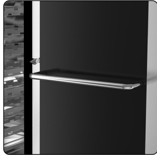
BEDIENBLLENDE-SCHUTZ AUS EDELSTAHL.