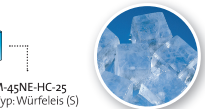
IM-45NE-HC-25 Eis-Typ: Würfeleis (S) Grösse: ca. 25 x 25 x 23mm